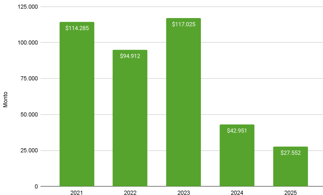
Gráfico 1. Evolución del monto de la Beca Manuel Belgrano 2021-2025.

Fuente: Elaboración propia en base a datos oficiales de la Secretaría de Educación del Ministerio de Capital Humano. Valores constantes a noviembre de 2023.