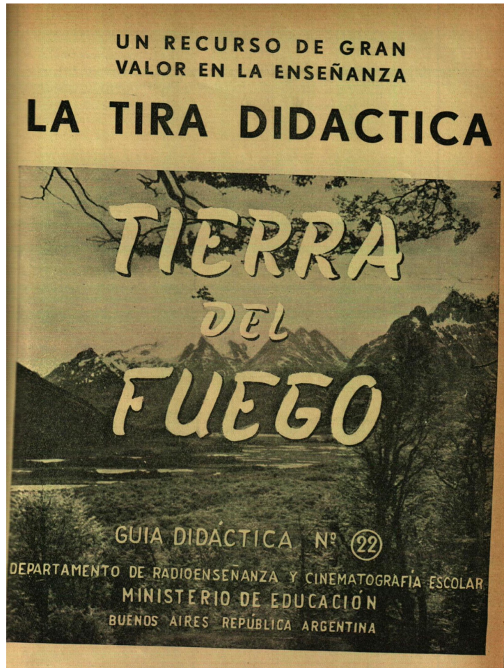
Sección Tira Didáctica "Tierra del fuego", Noticioso del Departamento de Radioenseñanza y Cinematografía Escolar n° 7, julio 1952, p. 17.

ellas contaba con un texto explicativo detallado con el objetivo de servir al docente como guía para poder llevar adelante la clase.