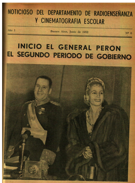
Portada del Noticioso del Departamento de Radioenseñanza y Cinematografía Escolar n° 6, junio 1952.

Al respecto es posible esbozar tres cuestiones centrales, relacionadas entre sí, que crean tensiones entre una parte importante de la plana docente y las políticas emanadas por el peronismo. La primera pasa por el culto al personalismo, que chocaba con las premisas tradicionales de la docencia como una carrera de origen y tendencias liberales, tal como se lee en un poema publicado en la editorial correspondiente a los números de mayo y junio de 1953, un año después de la desaparición física de Eva Perón: