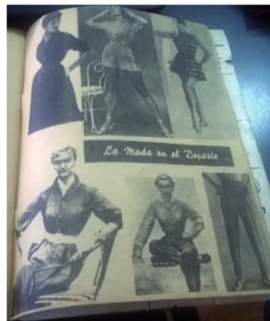
Imagen 2: La moda en el deporte.