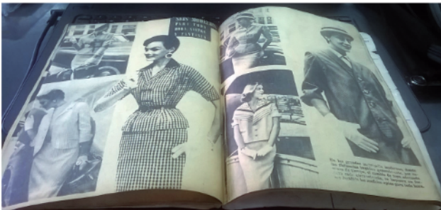
Imagen 1: Seis modelos para toda hora. Sastré y fantasía.

a continuación podemos apreciar 6 páginas destinadas a la sección Modas, la que más páginas posee dentro de la publicación. Se trata de un apartado repleto de fotografías de mujeres mundanas, elegantes, modernas e insertas en el mercado laboral. Allí se exhiben, con sus modelos correspondientes, seis modelos para toda hora: sastré y fantasía.